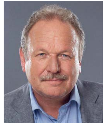
Frank Bsirske ver.di-Vorsitzender

„Wir haben in den Verhandlungen ein sehr gutes Ergebnis erreicht. Mit der Tabellenerhöhung konnten wir gegenüber dem ursprünglichen „Angebot“ der Arbeitgeber eine deutliche Reallohnsteigerung durchsetzen. Die Angriffe der VKA auf die Zusatzversorgung haben wir abgewehrt. Wir stehen zur betrieblichen Altersvorsorge im öffentlichen Dienst und bei nachgewiesenem Handlungsbedarf sind Mehrkosten paritätisch von den Arbeitgebern und den Beschäftigten zu tragen.“