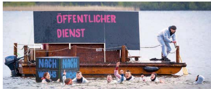
Aktion der ver.di Jugend in Potsdam: Ohne Übernahme geht der Nachwuchs baden