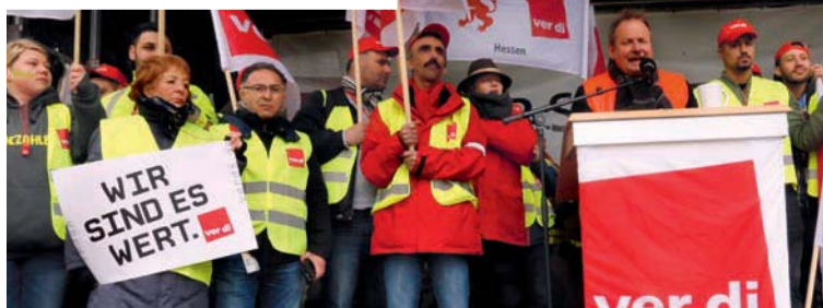
Frankfurt am Main